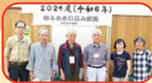
協力：『心ふれあいSA吹田』 ロボット部会の皆さん

ロボット教室は大人気で多数のご応募を頂きました。電池とモーターを使って動く火星探査車を、みなさん大事に持ち帰りました。