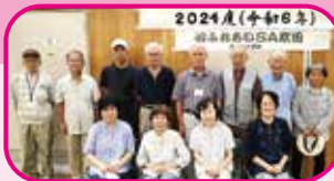
協力：『心ふれあいSA吹田』 おもちゃ部会の皆さん

身近な材料を使って作る「おもちゃ」を12種類、用意しました。小さなお子様も自分で作って、楽しむことができました。