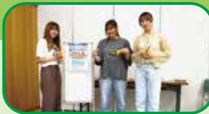
協力：『そらまめ』 大和大学の皆さん

スーパーボール・プラ板・魚釣りの3種類を用意しました。中でもプラ板は人気で、皆さん上手に絵を描いていました。