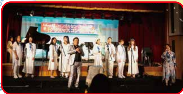
Powrus Harmony (ゴスペル)

コミセン クリスマスコンサートは、今年で2回目となります。 「Powrus Harmony」と「アイランドウインドオーケストラ」による素晴らしい コーラスと演奏をお楽しみください。