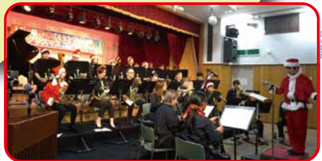
アイランドウインドオーケストラ (吹奏楽)

開 場：午後 1 時 開 演：午後 1 時 30 分～午後 4 時 定 員：60 人 先着順 対 象：小学生以上