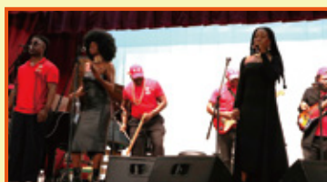
SHIMON presents &amp; アンゴラ共和国