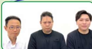
講師：スマホアドバイザーのみなさん