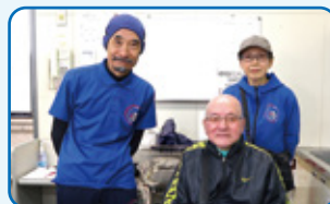
講師：吹田ボッチャの会さん

ビギナーさんが高得点されたり拮抗した好勝負に一喜一憂されたりの、楽しい時間でした。(文)